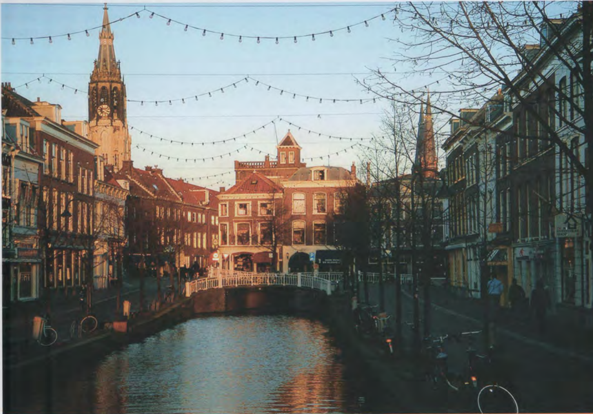
Above: Delft - pastoral view of a typical Dutch town that can afford a certain amount of experimentalism.